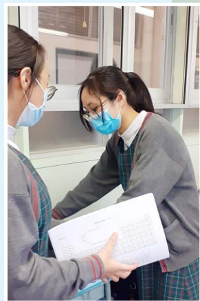
馮敏儀同學於課室內的日常