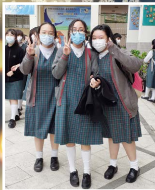
復課級別放學情景