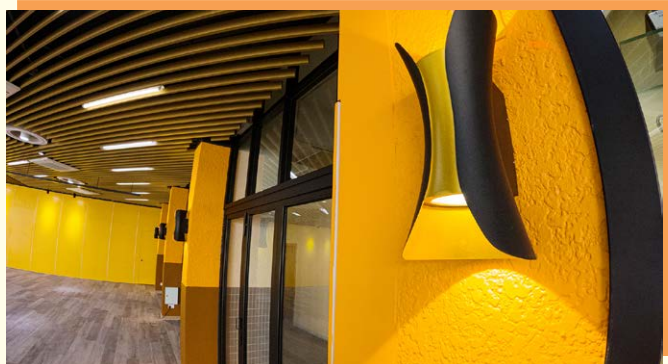
多元學習中心內的飾燈令氣氛更莊嚴