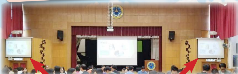
屏幕轉為86吋大電視 (左、右、後)

加裝電視和鐳射投影機後，坐在較後和旁側位置的同學也能清楚看見屏幕，方便他們學習和進行活動。