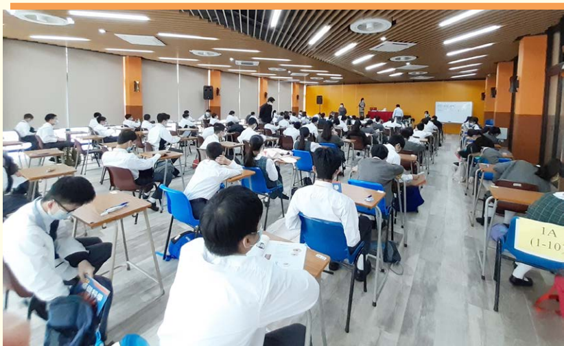
多元學習中心用作校內考試場地

負責工程的老師團隊因應中心的用途，選擇暖色為主調，明亮的橘色散發著歡樂、親切、溫暖及莊嚴的氣息。在色彩療法中，橘色有充滿生氣、振作精神的特質，加上新鋪建的灰色系地板，使橘色更加突出。呈斜線的假天花增加了動感，配合學習中心的活力氣氛。此外，為了幫助同學提高生產力及抖擻精神，在室內亮度、燈光來源及色溫等方面，老師團隊亦作出了相應的考量。他們選用了落地玻璃趟門的設計，利用自然光增加室內採光度，而燈光則選用LED光管為主要照明，射燈為輔助，加上壁燈以加強氣氛。多元學習中心每一個設計細節都體現了學校對同學的用心。