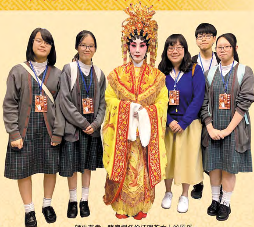
師生有幸一睹粵劇名伶汪明荃女士的風采。

梨園是指粵劇行業，上一代有不少粵劇迷，其中一位參賽同學的母親正是其一。在她穿針引線下，師生有機會訪問一位粵劇劇團經理，並帶他們走進新光戲院，拍攝《帝女花》劇目演出的幕後預備工作。「粵劇是極具地方特色的藝術，有豐富的歷史內涵，在香港及廣東一帶也曾輝煌一時，是重要的文化瑰寶，因此我們最後選擇這個主題。」黃老師補充道。