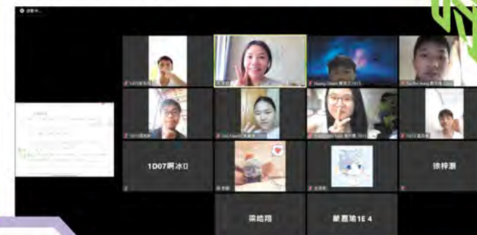
各科老師與學生以實時教學方式上課。

隨着停課的日子延長，本校在4月20日開始進行全校實時教學，以提升教學效能，加強師生聯繫，並協助學生在家中建立良好的學習規律。校方舉辦了多場網上工作坊，為教師進行培訓，亦拍攝了教學短片，詳細教授學生如何正確使用實時教學平台。所有學生每天均會上課，初中同學每天上一至三節課，高中同學則每天上一至四節課。