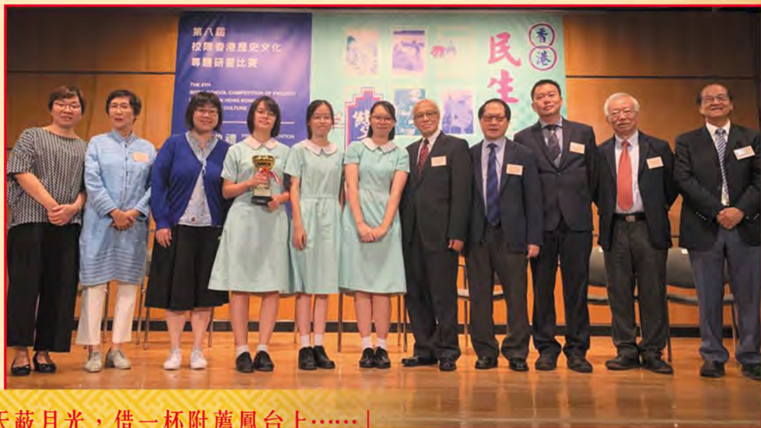
師生與一眾評審委員會成員合照。

「落花滿天蔽月光，借一杯附薦鳳台上……」 大家是否覺得歌詞似曾相識？這正是著名粵劇 《帝女花·香夭》一節中的詞句。