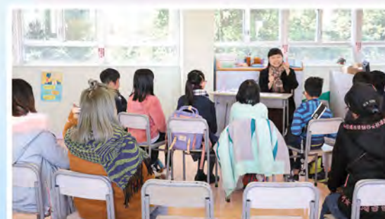
老師為小六同學講解面試技巧。