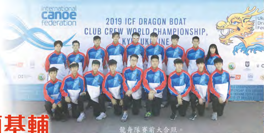
龍舟隊賽前大合照。