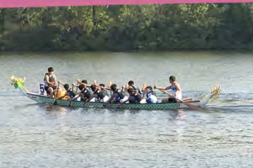
同學們不留餘力地比賽。