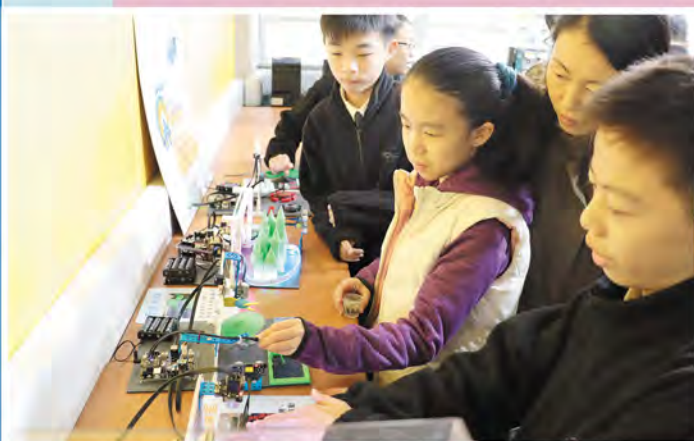
小六學生及家長可在開放日參與不同學科的活動。