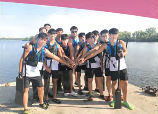
龍舟隊齊心一致為比賽作預備。