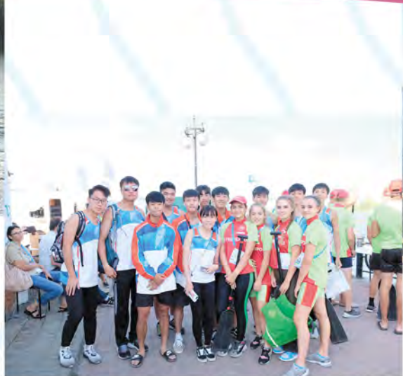
龍舟隊和外國隊伍的友好交流。