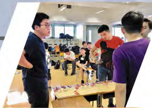
同學擔任義工，為比賽作好準備。