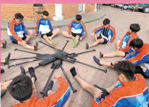
龍舟隊專心地進行賽前熱身。