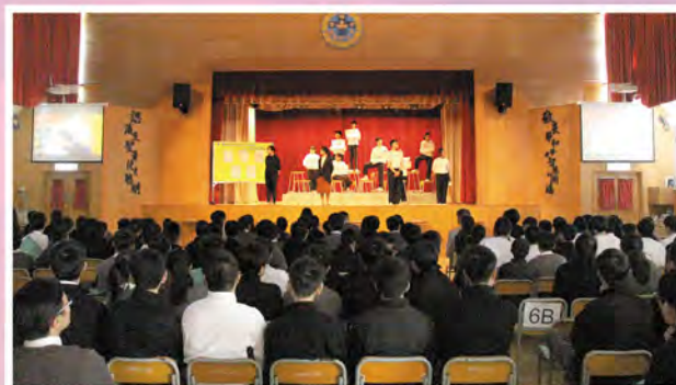
同學用心演出話劇。

時光荏苒，本校自一九九九年創校至今已屆二十載。二十年來，學校一直在神的看顧和帶領下以「仁愛、篤信、喜樂、博學、明辨、慎行」六項靈糧精神為本，為莘莘學子提供良好的學校環境，讓他們啟發潛能，發展所長，並成為對社會有承擔、貢獻的人。本校二十周年校慶主題為「創新·正向 靈糧翱翔」，希望藉此勉勵學生突破自己，建立正面的價值觀，在人生路如鷹般展翅上騰。為慶祝校慶，本校將籌辦一連串活動予大家參與，同享喜悅。