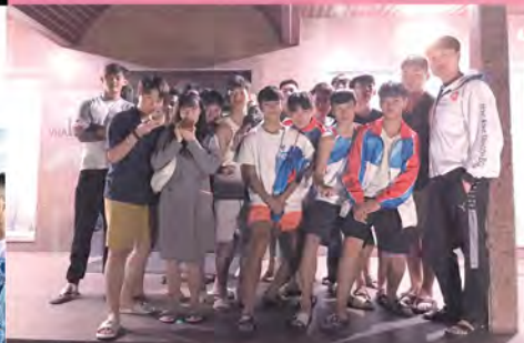
龍舟隊在烏克蘭渡過一個難忘的中秋節。