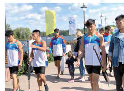
畢業生也為龍舟隊出一分力。