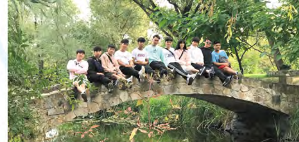
同學們遊覽著名勝地。