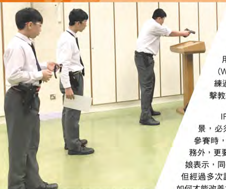
同學們不留餘力地比賽。

古有六藝，即教育的六個科目，為禮、樂、射、御、書、數。時至今日，「射」已不止於「射箭」，還加入了「射擊」，而是次介紹的是在香港漸漸普及的「氣槍實用射擊運動」（簡稱IPSC）。或許大家對IPSC感到陌生，其實這項運動在香港已發展了十五年，在技術、規模、參加者水平等各方面均達到世界級水平，香港甚至主辦了2018年「第一屆IPSC氣槍射擊世界錦標賽」。