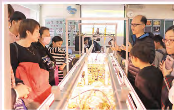
小六學生及家長可在開放日參與不同學科的活動。