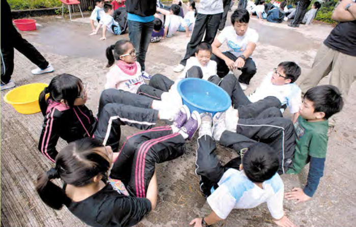
▲中一時的可勤(正中)活潑可愛