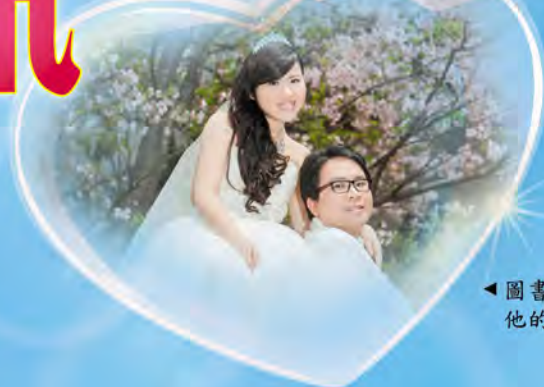
◀圖書館助理羅小姐與他的夫婿