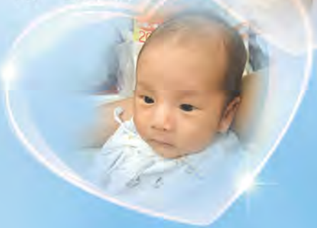
又多一個數學奇才▼