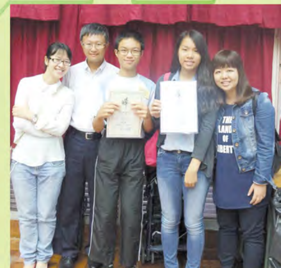
▲老師親身祝賀可勤奪得獎