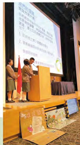
▲ 同學們在專題研習中向政府提出倡議