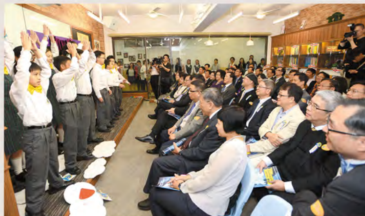
▲中一同學在英語自學中心啟用禮上作英詩朗誦表演