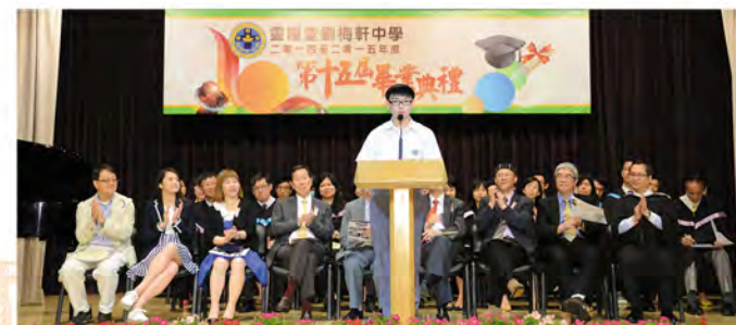
▲家賢代表畢業生致辭