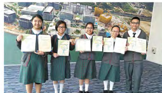
▲ 得到獎項，大家笑逐顏開