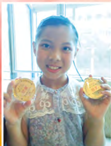
▲加恩一舉奪得兩項舞蹈比賽冠軍