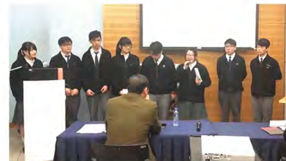
▲ 同學們在評審委員面前作口述報告