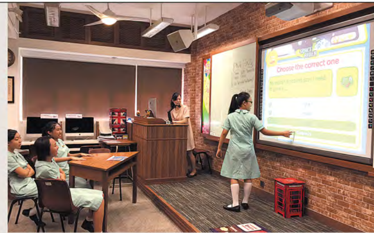
◀中一同學正投入英語電子遊戲當中