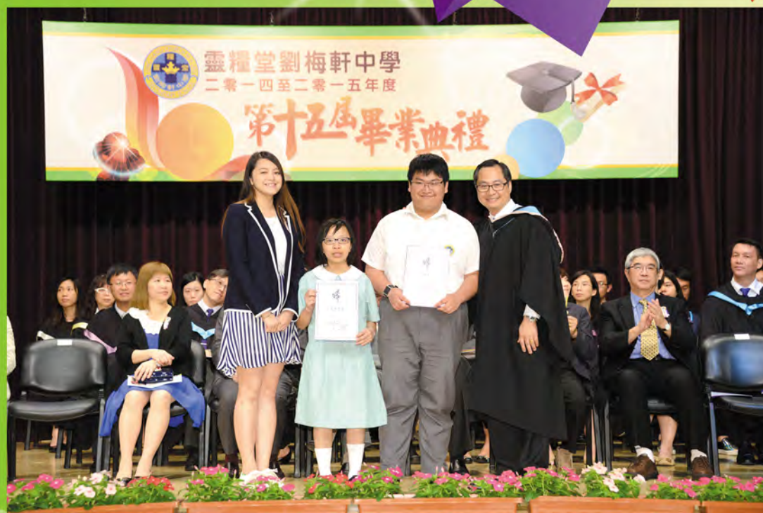
▶ 盈霖不怕艱辛，屢獲殊榮。