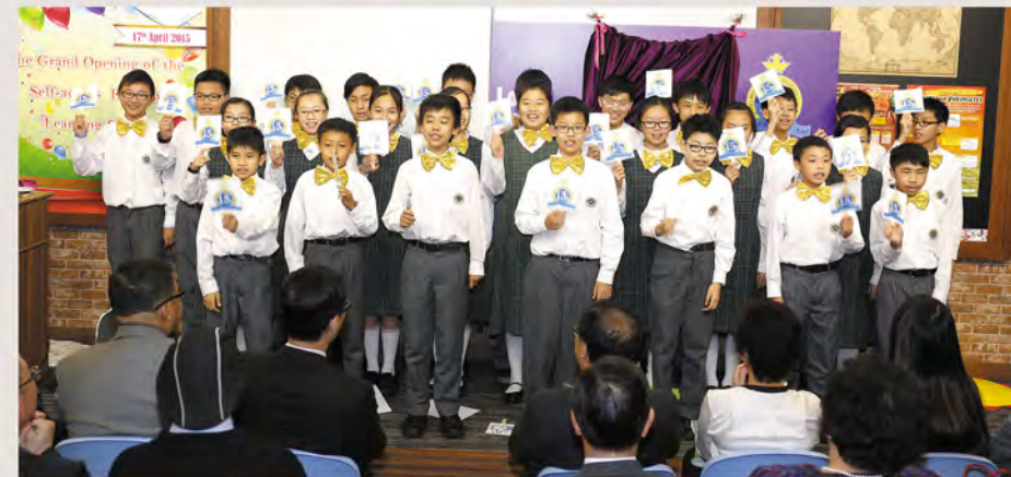
▲中一同學悉心打扮，表演精彩