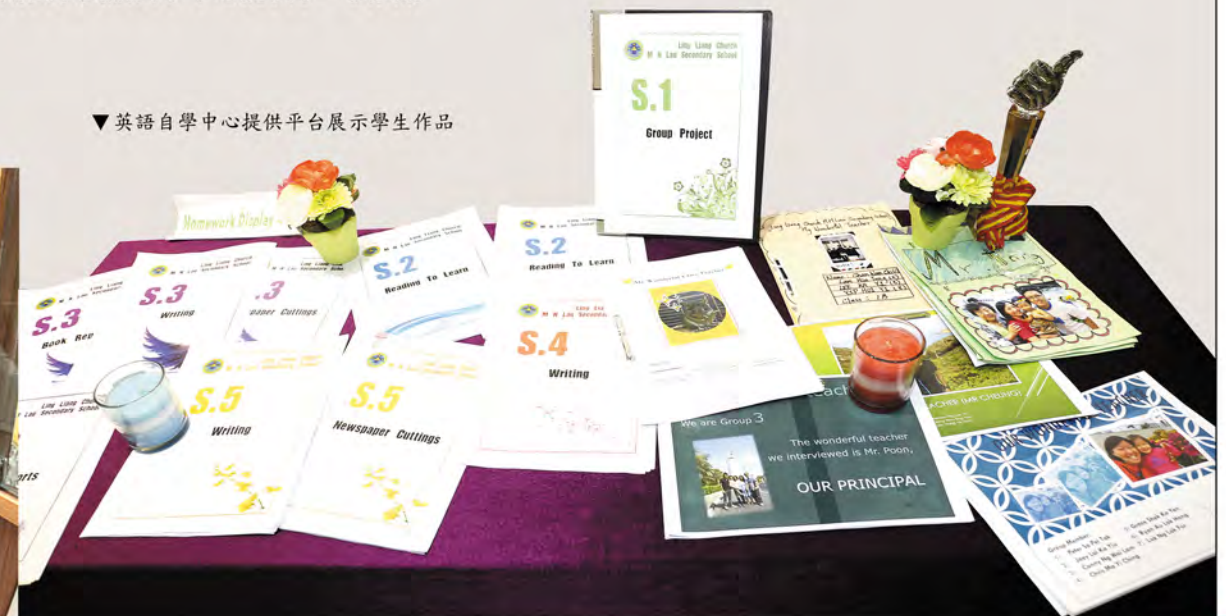
▼英語自學中心提供平台展示學生作品

英語自學中心將於十月正式開放，英文科老師會在午膳及放學時段當值。只要同學到英語自學中心簽到並使用設施，便可獲得英文科「自學獎勵計劃」的分數，而分數高的同學，最後會得到獎勵。在英語自學中心，既可以學習英語，又可以獲得獎勵，一舉兩得，怎可少了同學的參與呢？