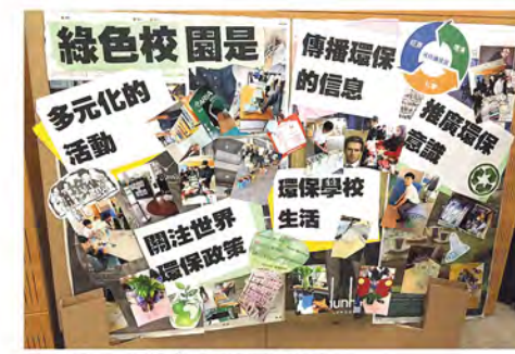
▲ 獲得設計優秀獎的冠軍海報