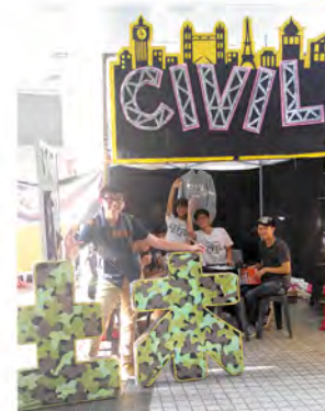
◀在香港科技大學的生活多姿多彩。