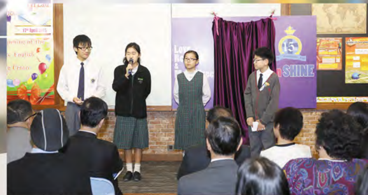
▲四位同學擔任英語自學中心啟用禮的司儀

緩緩走過一樓的走廊，映入眼簾的是新落成的英語自學中心，走廊牆壁上一幅幅相片，勾起了大家對學校英語教學發展的回憶。