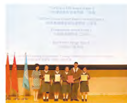
▲ 最緊張的頒獎時刻到了