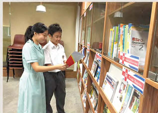
▼同學在英語自學室閱讀雜誌