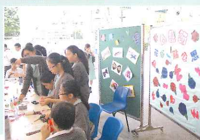
▶母親節髮夾製作活動