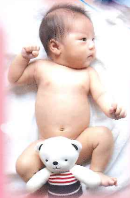
湘玲老師BB的 第一張藝術照