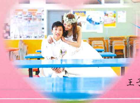
王子與公主，天作之合