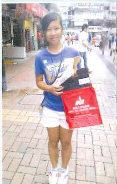
▶為義務工作發展局賣旗籌款