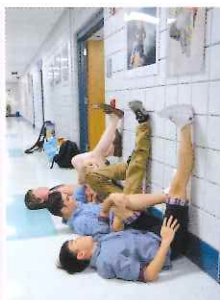
◀同學在課室走廊外做拉筋運動