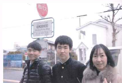
▲逸榮與日本同學一起上學去