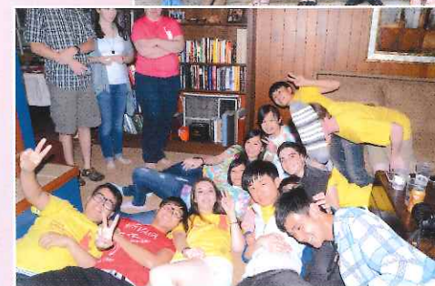
▲美港學生打成一片