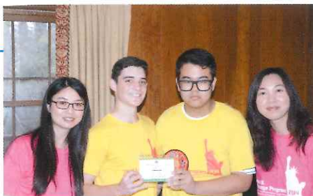
▲慶利與老師致送紀念品給當地學生

「在教育制度方面，常看見香港老師在轉堂的時候，辛辛苦苦地捧著一疊疊書本和習作，匆匆走到下一班上課。到了美國，只見老師舒舒服服地留駐在某一個課室裡，等待不同班別的學生入內上課，