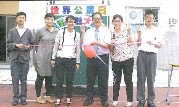
▲世界公民日活動開幕禮

「還有，平時和隊員開會，可學到如何與不同年級的同學溝通，聽取不同的意見。籌辦活動時，也學到怎樣分工，怎樣宣傳，怎樣佈置場地等。」想不到服務經歷不但令同學心智更成熟，還帶來多元能力的提升呢！