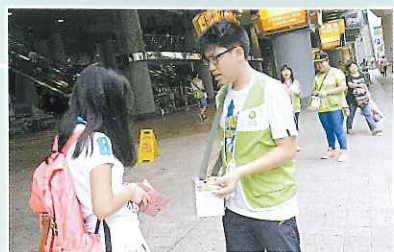
▲為樂思會向路人籌款