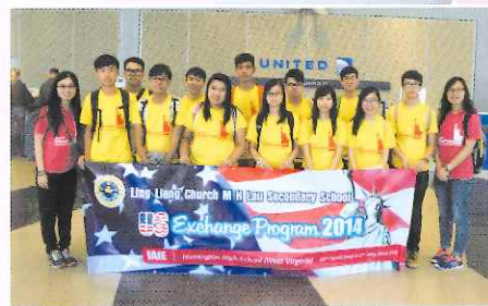
▲到達美國機場合照