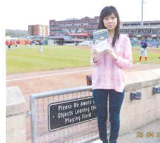
▼洛頤參觀棒球比賽