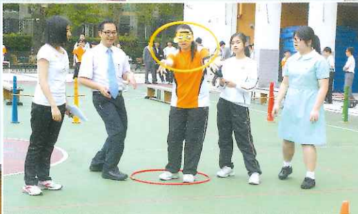
◀公民教育周的盲人障礙賽