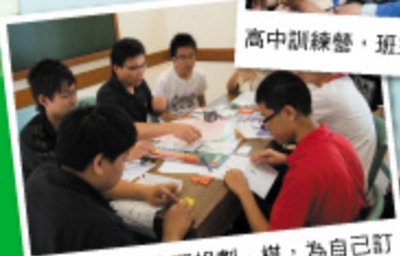
學生透過「生涯規劃」棋，為自己訂立升學目標