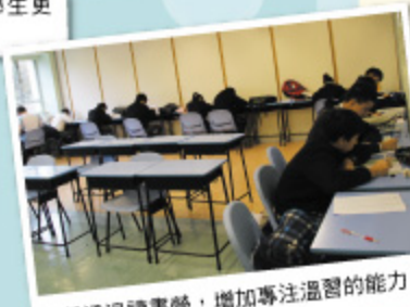
同學透過讀書營，增加專注溫習的能力