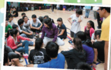
高中訓練營，班主任與學生分享學習生活

總結首屆中學文憑試之成績，各科老師已作檢視，並且優化教學及備試策略，以協助來屆學生在文憑試中爭取更理想的成績。