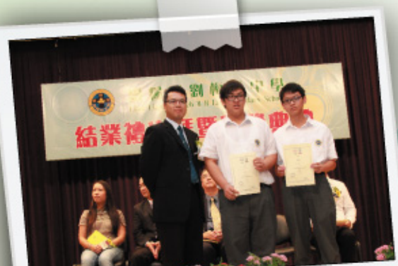
數學科第二屆全港中學生數學短片創作比賽獲獎同學

對於未能加入小組的同學，我們仍嘗試以多元活動，引發他們對數學的興趣。其中本科計劃舉辦劇本創作比賽，選題為數學的「進制」問題，希望同學以創意短劇形式表達對課題的了解。比賽得獎作品將會被製作成短片，除用作參加比賽外，更可作為教學材料。同學在課堂內看見老師採用自己的作品進行教學，那種滿足感是何等之大呢！