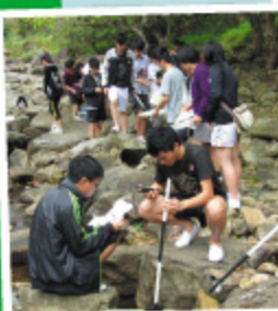
進行野外考察，令學生更掌握課堂學習的知識