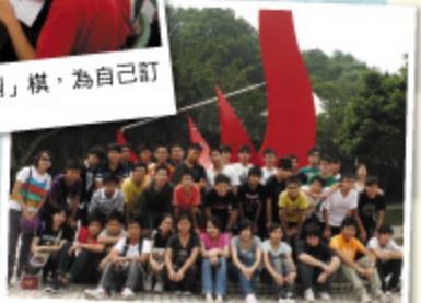
學生參觀科技大學，為晉升大學及早準備