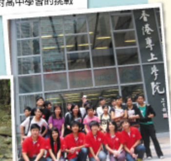
學生參觀各大專院校，為自己訂立升學的目標