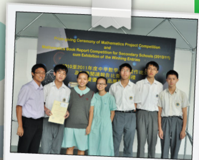
數學科專題報告比賽頒獎禮