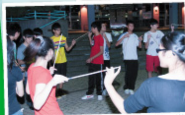
在集體遊戲中，同學合作解決困難，增強團隊精神，共同面對高中學習的挑戰