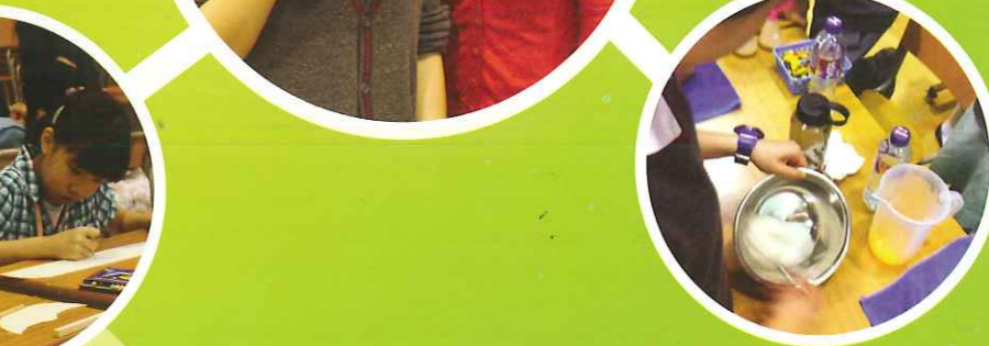
同學們與家長一同參與不同的科學實驗,親子活動中一起玩一起樂。