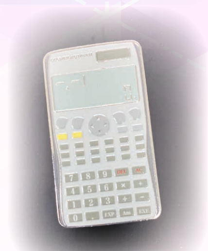
鼓勵多元發展，展現學生才華