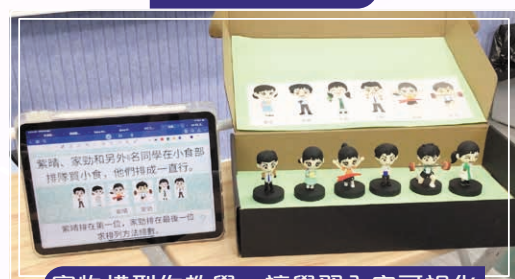
實物模型作教學，讓學習內容可視化