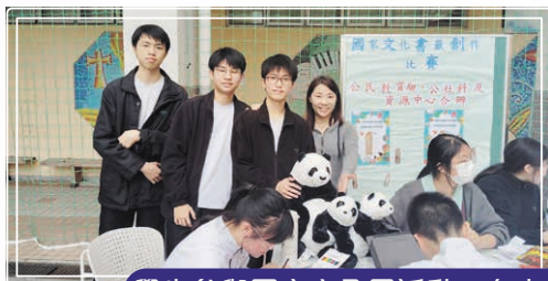
學生參與國家安全日活動，有本校的國家安全文化小組舉辦攤位遊戲