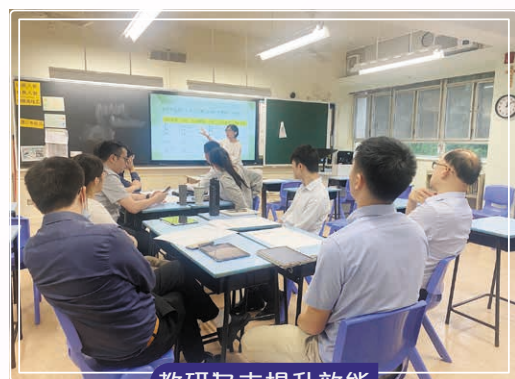
教研為本提升效能

為協助中六同學準備公開考試，學校邀請資深數學老師舉辦應試策略分享會。講者分析歷屆試題趨勢，傳授答題技巧與時間管理，幫助學生掌握考試資訊，增強信心，爭取理想成績。