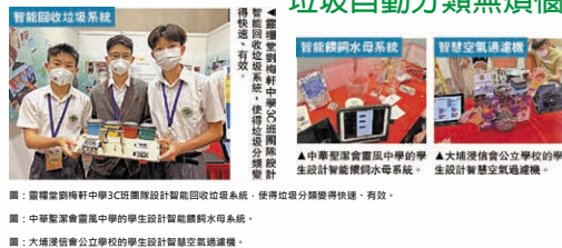
圖：靈耀堂劉梅軒中學3C班團隊設計智能回收垃圾系統，使得垃圾分類變得快速、有效。

▲中華聖潔會雷風中學的學生設計智能回收水母系統。 ▲大埔浸信會公立學校的學生設計智慧空氣過濾機。