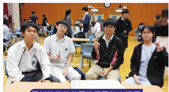
因材施教的分層教學及校本課程