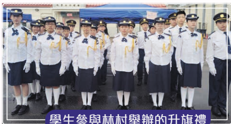
學生參與林村舉辦的升旗禮

為慶祝中華人民共和國成立 75 周年，林村鄉公所聯同大埔區青年發展及公民教育委員會，於 2024 年 9 月 21 日假林村許願廣場舉辦「林村升旗台開幕典禮暨大埔區愛國教育制服團隊大滙操」。我校升旗隊參加了這莊重的儀式，展現了對國家的忠誠與榮譽。這些活動不僅增強了學生的社會責任感，也培養了他們對國家的認同感和驕傲。