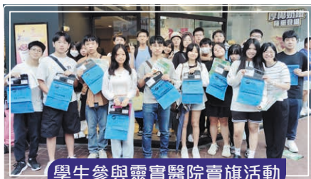
學生參與靈實醫院賣旗活動