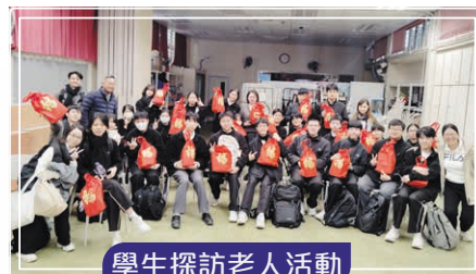
學生探訪老人活動