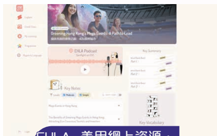
EHLA 善用網上資源， 增強自學能力