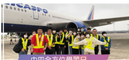
中四全方位學習日 參觀香港國際機場禁區