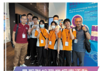
暑期聯校職業探索活動 參觀金管局