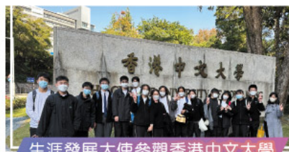
生涯發展大使參觀香港中文大學