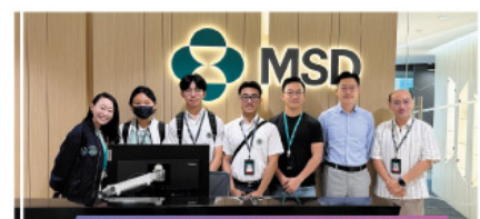
師友計劃 - 參觀默沙東藥廠