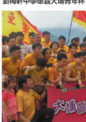
劉梅軒中學體育隊在「大埔區龍舟錦標賽」中奪得冠軍。