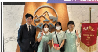
師友計劃 - 參觀AIA保險公司