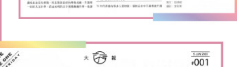
▲學生利用新科技進行學習。

【本報專訊】在停課期間，學生們通過新科技進行學習，確保了學習的連續性。這體現了教育與科技的深度融合。