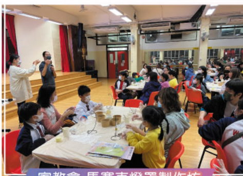
家教會 馬賽克燈罩製作坊

本校家長教師會再度獲得家校合作事宜委員會資助，並再次與區內小學合辦親子工作坊系列 — 家校齊心繫中小2022。此外，為推動家長投入校園活動，本會的家長義工預備了精美的禮物和心意卡，讓同學可以在父母親節前夕，拿回家轉送給父母，以表孝心。又為鼓勵環保，家長義工安排了環保校服回收和轉贈活動。聯誼方面，本會亦舉辦了春茗和旅行等活動。