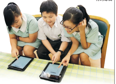
▲同伴伴讀計劃，建立學生閱讀興趣。