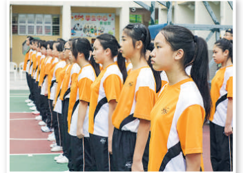
▲中一軍訓旨在協助學生培養紀律及團隊精神