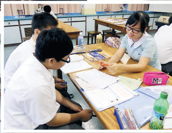
▲中四學生參觀幼稚園，藉此認識幼兒工作的實況。