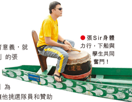
●張Sir身體力行，下船與學生共同奮鬥！

為着二十多個原本不被看好的學生而更改考期，校長的決定並非人人支持。「一開始也有老師和家長質疑我的決定，但當你看到龍舟隊的付出，你就知道這決定是對的。他們本來是缺乏方向和目標的學生，現在他們找到自己的目標，是多麼難得！因此，我更加應該要支持他們。我們做的是教育工作，教的是人生意義。有時候，有些東西，比如目標和自信，比書本更能幫助學生成長。」現今社會，講求成本效益，像學校很多時候也比較重視成績和結果，因而忽略和埋沒了個別學生的潛能，這很可惜；亦有不少學校寧願放棄較差的學生，集中資源去照顧成績較好的學生，然而，潘校長卻不以為然：「我覺得過程有時候比結果重要。教育講的不應是你得到幾多分，而應該是你學到了多少。有學生來求我讓他們去比賽，總是不肯放棄……情況就如兩父子，當看見兒子如此努力，做父親的，實在沒有理由不支持下去吧？」