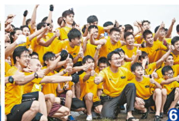
7. 數年來，靈糧堂劉梅軒中學龍舟隊已贏得不少獎項。