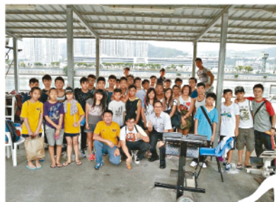
●校長不時抽空支持學生。

都說香港人功利，於是夢想成了是很多人眼中的奢侈品。口裏說說，消費夢想的人，很多；能夠真正努力實踐的人，很少。小記自己也是個運動發燒友，唸大學的時候參加過足球和龍舟的校隊。想那不遠的當年，小記一星期差不多七天也在練習，為的就是一個大專冠軍，一次「搏盡無悔」的經歷。正因如此，小記更能體會他們的心情。採訪完畢，感動久久不散，因此回到公司就立即要求編輯，為這次報道增加版位。「寫好啲！」她說。雖然文字可能不夠傳神，但希望這個熱血故事能稍稍感動同學，尤其是讀書成績或許不夠好的你。